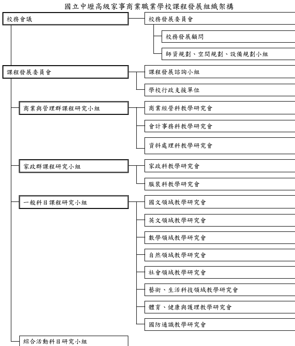
圖 1 課程發展組織架構圖