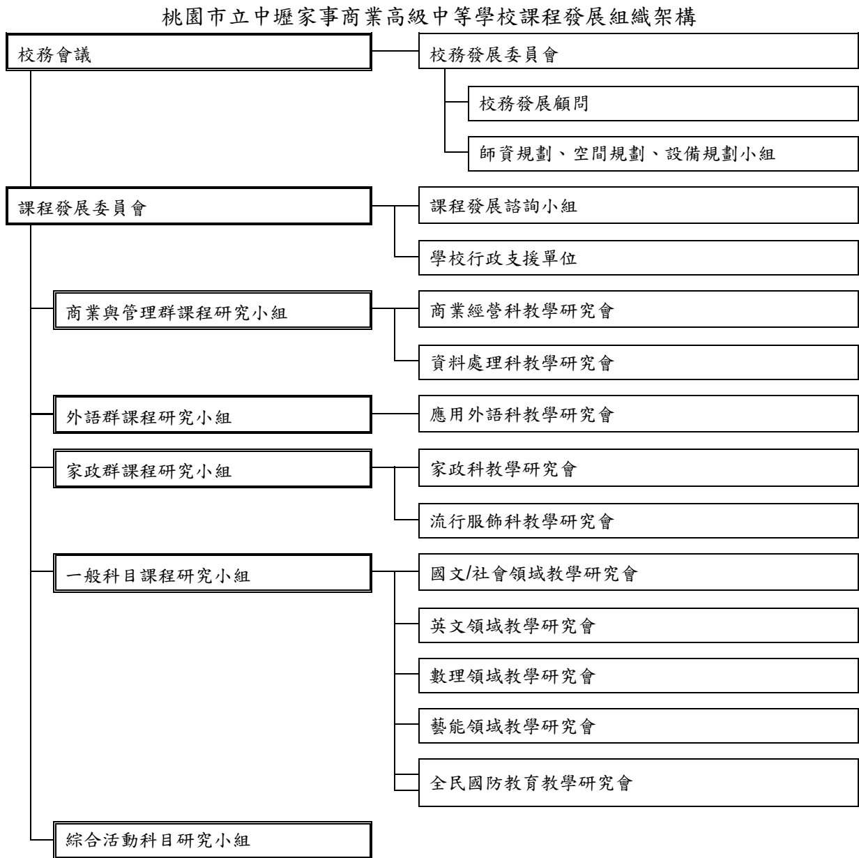
圖 2-2-1 課程發展組織架構圖